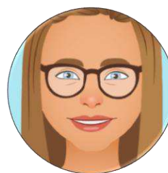
Zelma, Comlzed's egen virtuelle hjælper